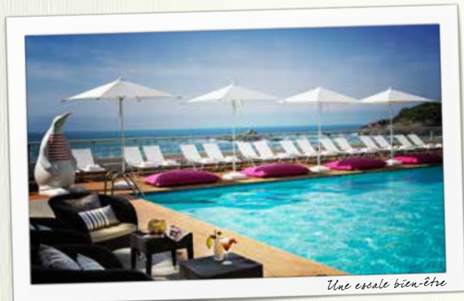
Une escale bien-être

4 PAVILLONS INTIMISTES dédiés au bien-être et un Institut de beauté, proposent un large choix de programmes et de soins à la carte prodigués par des experts. Sauna, hammam oriental, salle de fitness, piscines extérieure et intérieure d'eau de mer chauffée en accès libre.