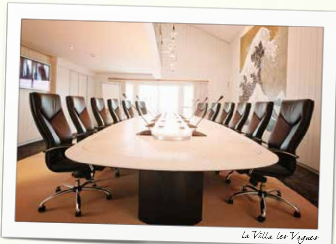
la Villa les Vagues